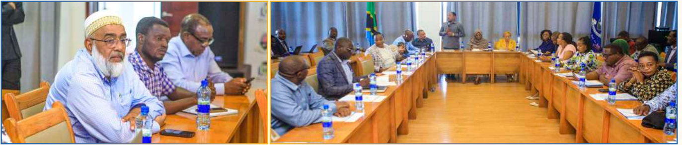
Maazimio: Wajumbe wa Kamati ya Kudumu ya Bunge ya Elimu, Utamaduni na Michezo wakiongozwa na baadhi ya viongozi na wafanyakazi wa Chuo Kikuu cha Dar es Salaam wakati Kamati ilipotembelea Chuo Kikuu cha Dar es Salaam ili kuona utekelezaji wa Mradi wa HEET, hivi karibuni.