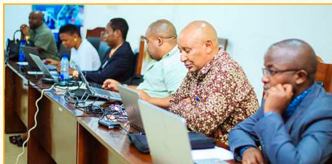
Kamati ya Ufuatiliaji, Tathmini na Mafunzo (MELL) katika mradi wa HEET Chuo Kikuu cha Dar es Salaam ikiwa katika moja ya vikao vyake hivi karibuni

Kadri Mradi wa UDSM-HEET unavyoendelea kubadilika, kamati ya MELL inaendelea kuwa nguzo muhimu katika kuhakikisha mafanikio yake. Pamoja na timu yenye taaluma mbalimbali, mfumo wa wazi wa ufuatiliaji, na jitihada endelevu katika uboreshaji, timu hiyo ina nafasi nzuri ya kukisaidia Chuo kufikia malengo yake makubwa chini ya mpango wa HEET.