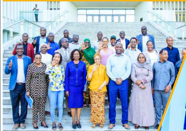
Wajumbe wa Kamati ya Kudumu ya Bunge ya Elimu, Utamaduni na Michezo wakiwa na baadhi ya viongozi na wafanyakazi wa Chuo Kikuu cha Dar es Salaam wakati Kamati ilipotembelea Chuo Kikuu cha Dar es Salaam ili kufahamu kuhusu utekelezaji wa Mradi wa HEET, hivi karibuni.