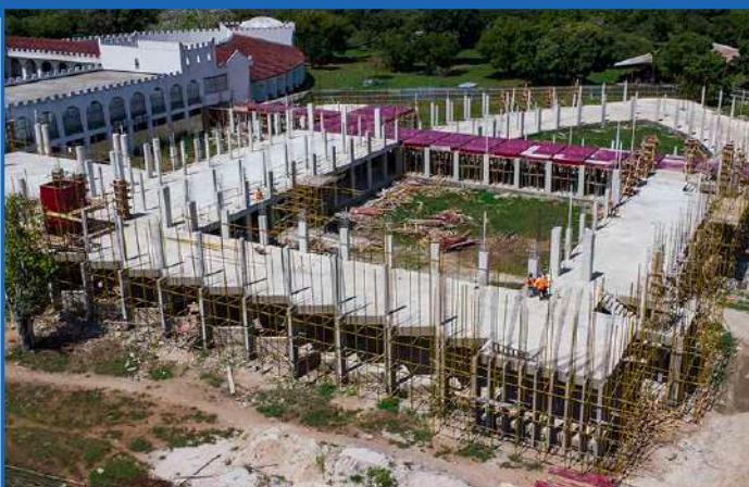
Ujenzi wa majengo ya Chuo Kikuu cha Dar es Salaam kupitia mradi wa HEET ukiendelea katika Taasisi ya Sayansi za Bahari (IMS), eneo la Buyu, Zanzibar.

Maendeleo haya yanadhihirisha kujizatiti kwa UDSM katika kutoa elimu na fursa za utafiti, kukuza mazingira jumuiishi ya kitaaluma, na kuchochea mabadiliko ya kiuchumi ya Tanzania kupitia elimu ya juu.