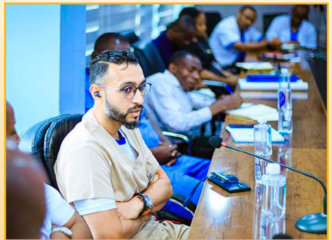
Baadhi ya Viongozi na Wafanyakazi wa Chuo Kikuu cha Dar es Salaam (UDSM) na wa Taasisi ya Moyo ya Jakaya Kikwete (JKCI) wakiwa kwenye kikao kujadili masuala mbalimbali kuhusu ushirikio baina ya taasisi hizo.