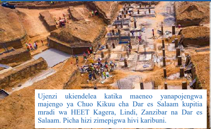
Ujenzi ukiendelea katika maeneo yanapojengwa majengo ya Chuo Kikuu cha Dar es Salaam kupitia mradi wa HEET Kagera, Lindi, Zanzibar na Dar es Salaam. Picha hizi zimepigwa hivi karibuni.