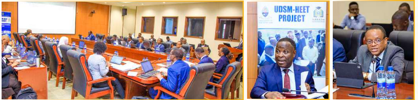
Mipango kwa ajili ya Matokeo Makubwa: Kikao cha 7 cha Kamati ya Taasisi ya Usimamizi ya Mradi wa HEET Chuo Kikuu cha Dar es Salaam kilichofanyika tarehe 21 Agosti, 2024, Kibaha, Pwani.