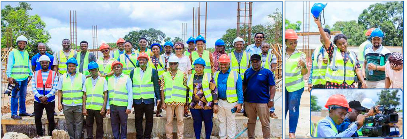
Matarajio Chanya: Waandishi wa Habari na baadhi ya Wataalamu wa Kamati ya Utekelezaji wa Mradi wa HEET Chuo Kikuu cha Dar es Salaam walipotembelea eneo ambapo ujenzi wa majengo ya Chuo Kikuu cha Dar es Salaam kupitia mradi wa HEET, katika Mkoa wa Lindi unaendelea.